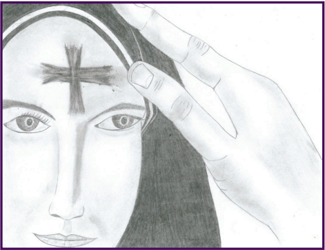
Dibujo hecho por un joven en la juvenil correccional.

Dejamos las cenizas en nuestras frentes hasta que desaparece en forma natural. Son un testigo público de esas cosas que la sociedad no quiere aceptar: la realidad de la muerte, la penitencia del pecado y la esperanza de la resurrección de Nuestro Señor.